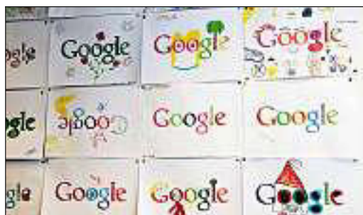
Kunstverkene som pryder pauserommet er ikke laget av de ansatte, men av barn og unge fra hele landet. Innimellom brukes tegningene på google.no.